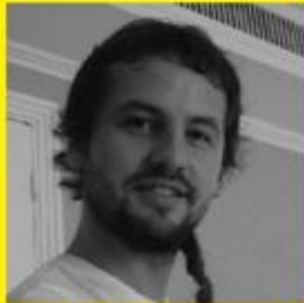
Nico Perlin Estas en la Luna